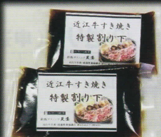
③特製割下150cc×2袋 近江牛すき焼専用！2倍希釈