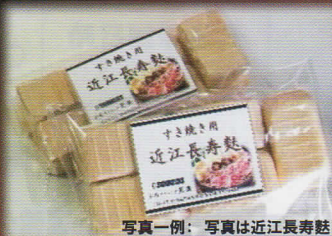
写真一例：写真は近江長寿麩