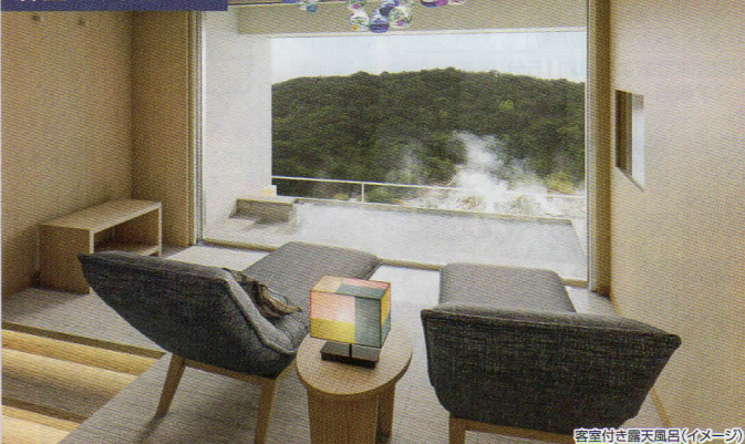
客室付き露天風呂(イメージ)