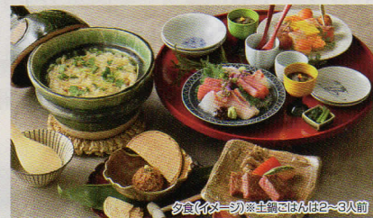
夕食(イメージ) ※主鍋は2〜3人前