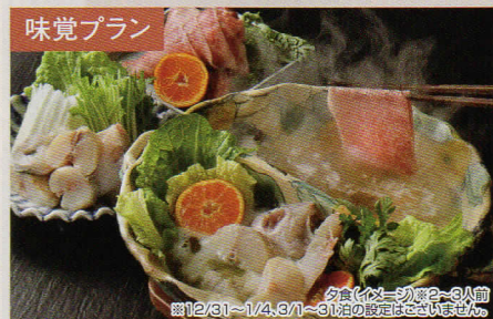
味覚プラン 夕食(イイ一臥)※2〜3人前 ※12/31〜1/4、3/1〜3/31泊の対応はございません。