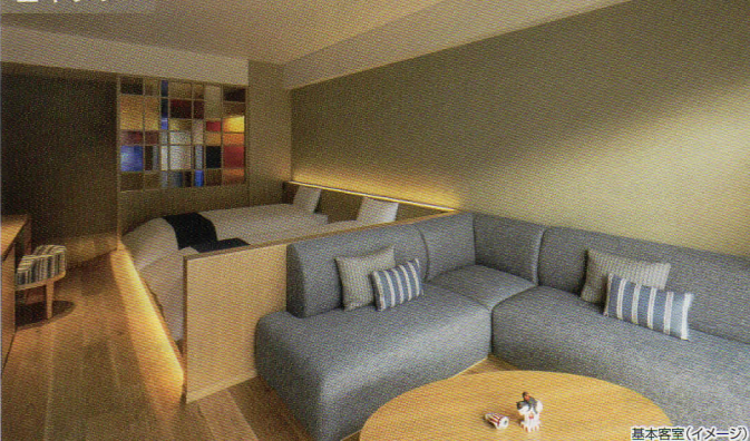
基本客室(イメージ)