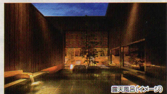
露天風呂(イイ一臥)