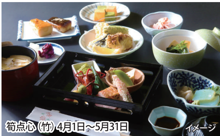
筍点心(竹) 4月1日～5月31日