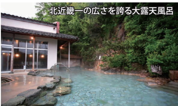
北近畿一の広さを誇る大露天風呂