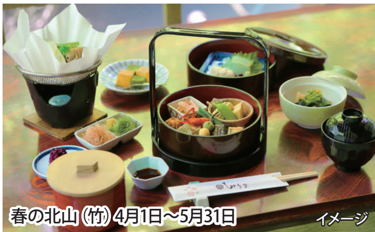
春の北山(竹) 4月1日～5月31日