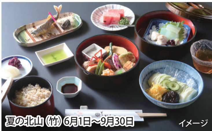
夏の北山(竹) 6月1日～9月30日